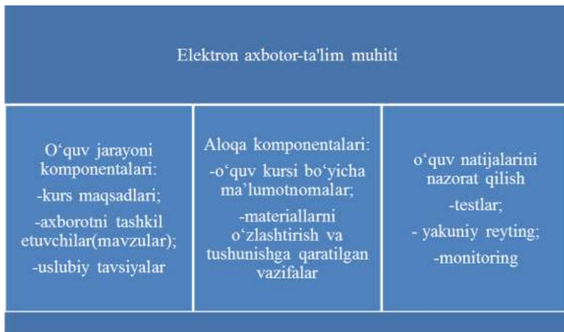
1-rasm. Axborot-ta’lim muhitini tizimli loyihalash

Shunday qilib, axborot-ta’lim muhitini tizimli loyihalashda biz quyidagi asosiy komponentalarga tayandik: ta’lim, baholash va aloqa (1-rasm).